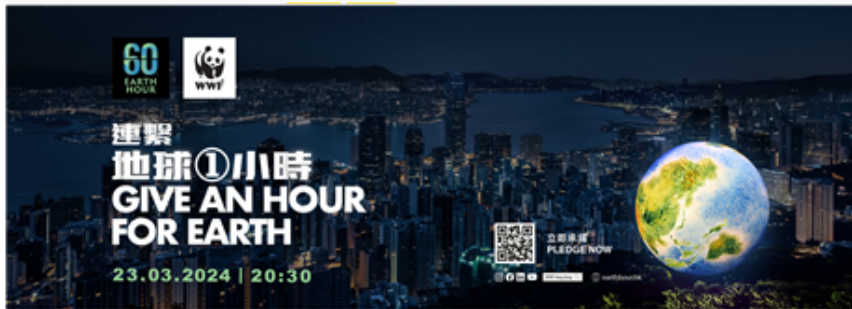
承諾支持世界自然基金會地球一小時 IS COMMITTED TO WWF'S EARTH HOUR